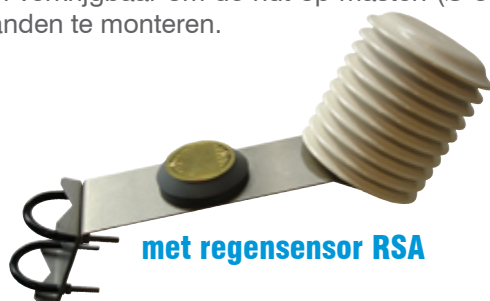
met regensensor RSA