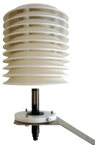
511-30 met Rotronic HygroClip