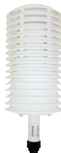
511-30 met Rotronic MP400