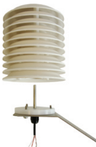
511-30 met Pt100